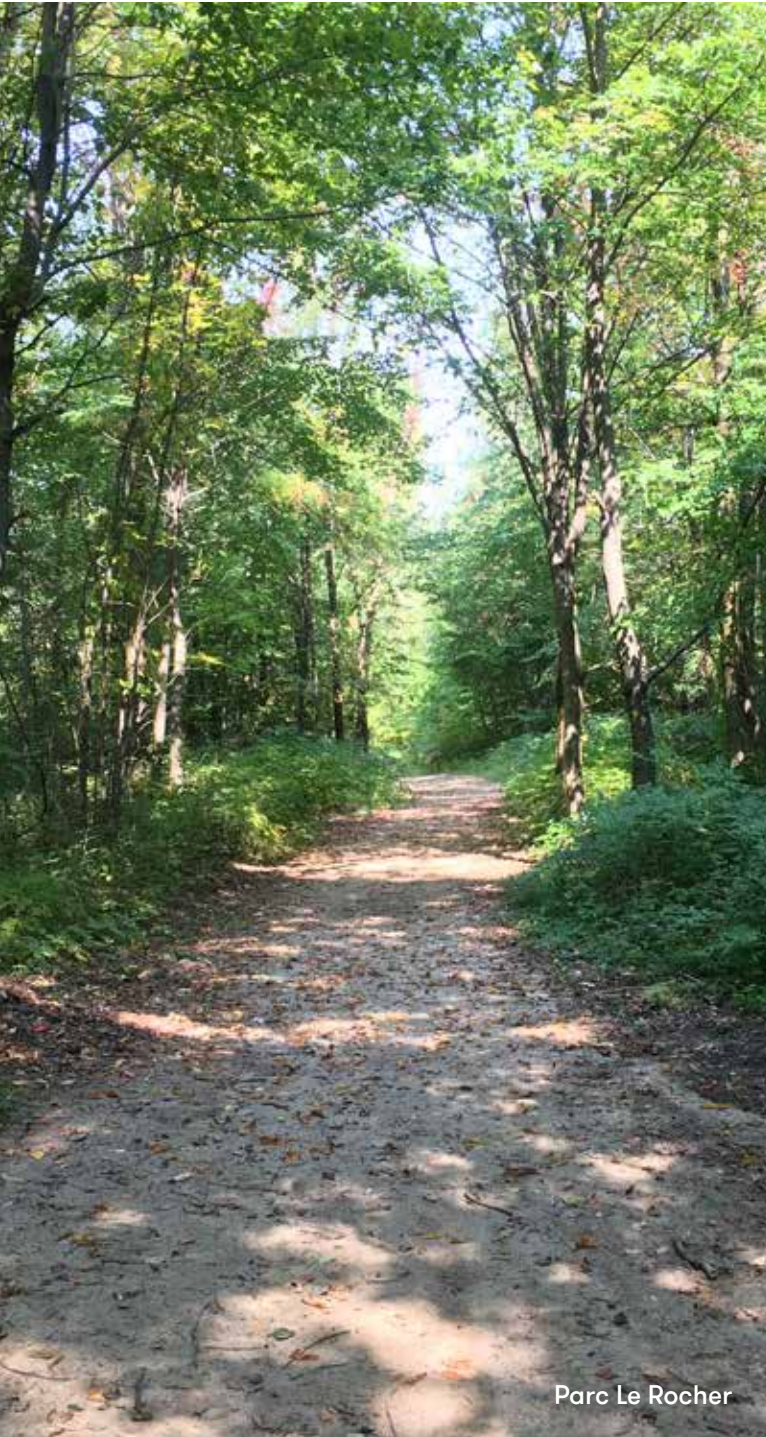
Parc Le Rocher